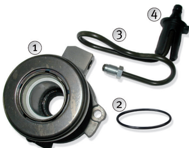
Fig. 1: Desmontar las piezas y eliminarlas

Fig 1: Extraer el cojinete hidráulico viejo (1), el anillo de obturación para la brida de la carcasa de la caja de cambios (2), el conducto conectado (3) y el manguito de plástico (4) para el paso del conducto a través de la carcasa de la caja de cambios y eliminarlo todo de forma correspondiente.