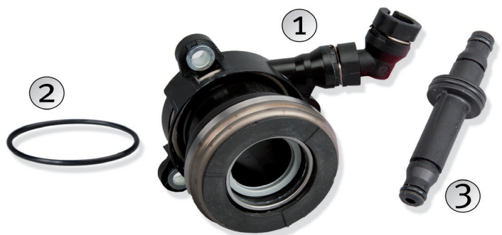
Fig. 2: LuK CSC 510 0073 10

Fig. 2: Tras sustituir el anillo de obturación (2), apretar a mano el cojinete hidráulico (1). Apretar los tornillos de forma uniforme para que el cilindro no se ladee. A continuación, insertar el adaptador (3) en el cojinete hidráulico a través de la apertura en la carcasa de la caja de cambios. Estará correctamente asentado cuando encaje de forma audible. Apretar los 3 tornillos de fijación del CSC a 10 (+1) Nm. Finalmente, insertar la pieza de conexión ( Fig. 3 ) en el extremo abierto del tubo del cojinete hidráulico. ¡Este también debe encajar de forma audible!