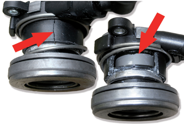
Fig. 5: Cojinete hidráulico dañado por una instalación errónea

Para proceder a la purga del cojinete hidráulico son necesarias dos personas. Se debe prestar atención