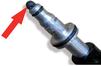
Fig. 4: Si no se ha retirado el anillo de obturación anterior, se presionará hacia el CSC atascando el conducto

Tras la sustitución del cojinete hidráulico es necesario purgar el sistema. El proceso de purga se divide en dos pasos. Por una parte, se purga el accionamiento del embrague, por la otra, se purga el cojinete hidráulico.