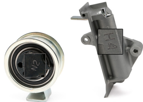
Fig. 2: Polea tensora 531 0436 20 con amortiguador de vibraciones 533 0035 10